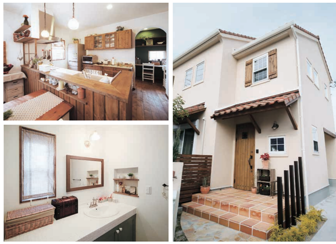
【右】青空に映える清潔感のある白い壁や素焼きの瓦、白い窓枠など、南仏地方の住まいをイメージした可愛くて温かみのあるデザインは、アプローチや植栽にもこだわって 【左上】使い勝手の良いキッチンのは後ろには、パントリーも兼ねた奥様専用の家事室を設けている 【左下】雑貨も映えるタイル張りのパウダールームは、洗面台の広さを2倍に取ってゆったりと